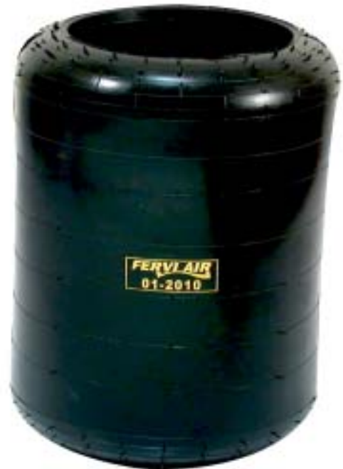
TABLA DE DIMENSIONES